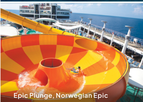
Epic Plunge, Norwegian Epic