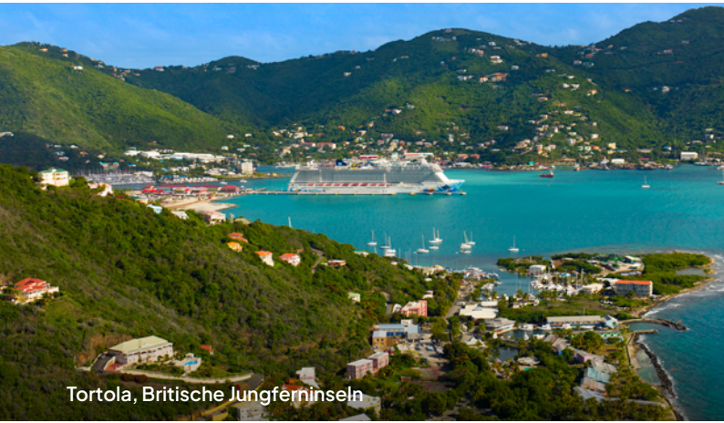
Tortola, Britische Jungferninseln