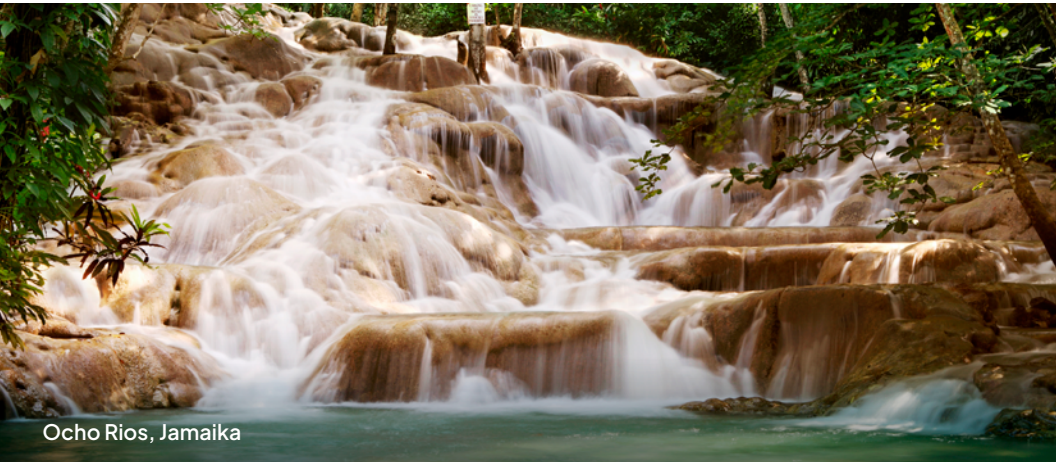
Ocho Rios, Jamaika