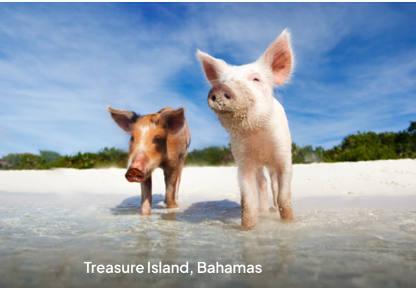
Treasure Island, Bahamas