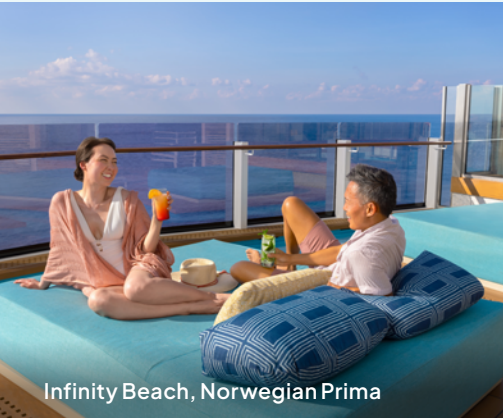
Infinity Beach, Norwegian Prima