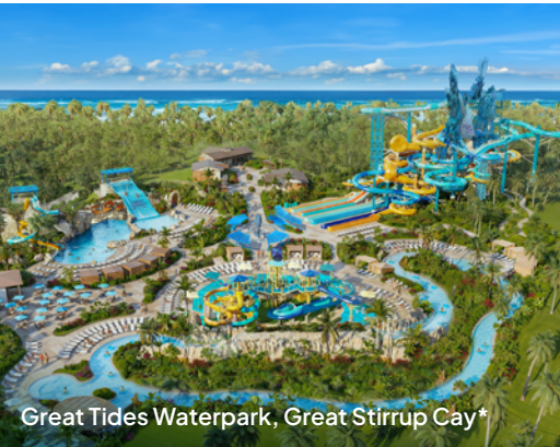
Great Tides Waterpark, Great Stirrup Cay*