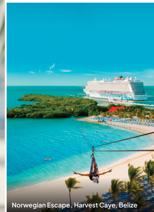
Norwegian Escape, Harvest Caye, Belize

Was könnte schöner sein als ein Tag im Paradies? Ganz klar, ein Tag im eigenen Paradies! Willkommen auf Great Stirrup Cay, NCLs privater Insel auf den Bahamas – ein Rückzugsort, ganz auf Spaß und Entspannung ausgerichtet. Eingebettet in warmes, türkisfarbenes Wasser erwartet dich hier eine perfekte Mischung aus Erholung, Aktivitäten und kleinen Luxusmomenten. Oder entdecke auf einer Kreuzfahrt durch die westliche Karibik Harvest Caye – NCLs exklusive Insel im Resort-Stil vor der Küste von Belize. Erkunde die üppige Natur, genieße entspannte Stunden am Strand oder tauche bei einem Ausflug aufs Festland in die lebendige Kultur und Traditionen von Belize ein.