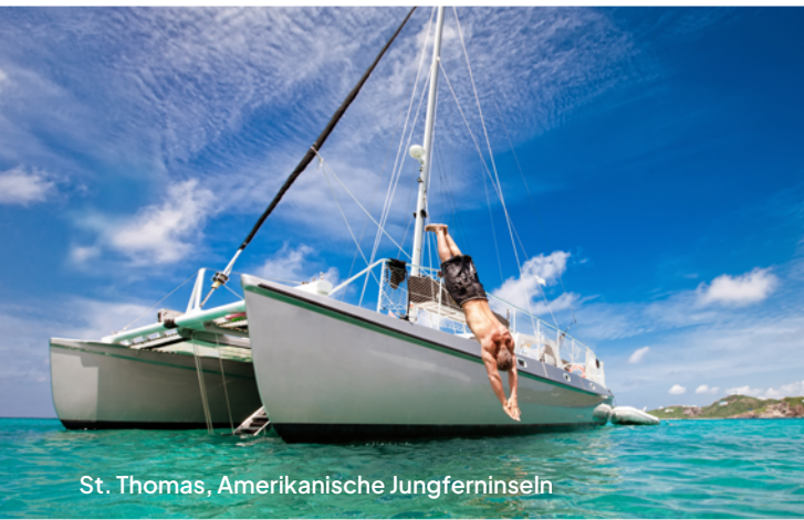
St. Thomas, Amerikanische Jungferninseln