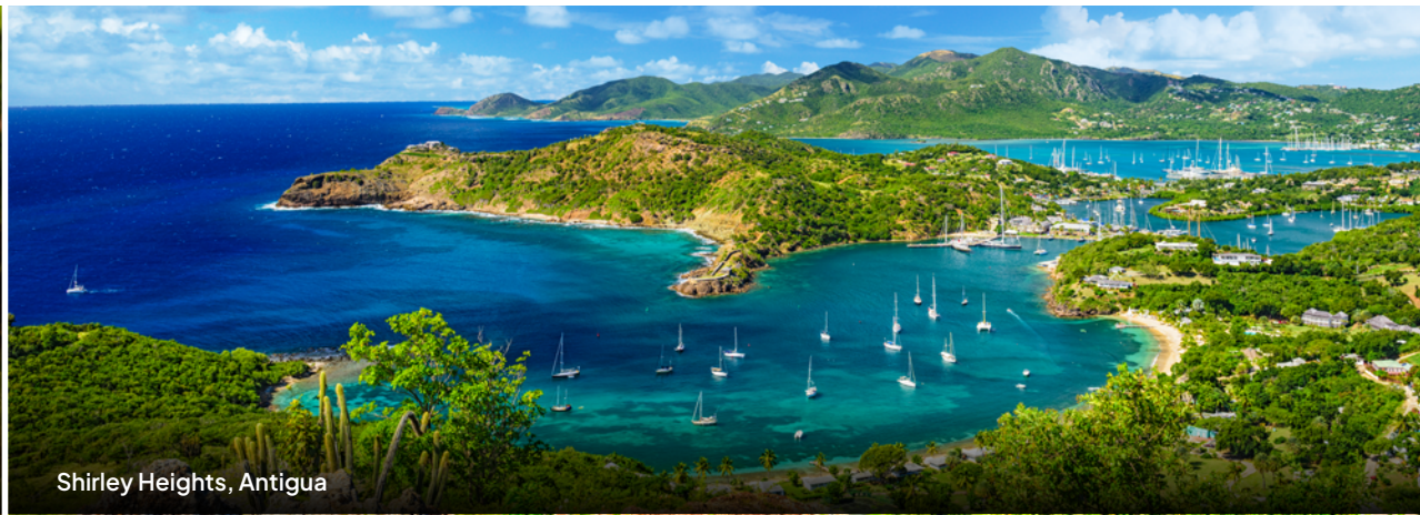
Shirley Heights, Antigua