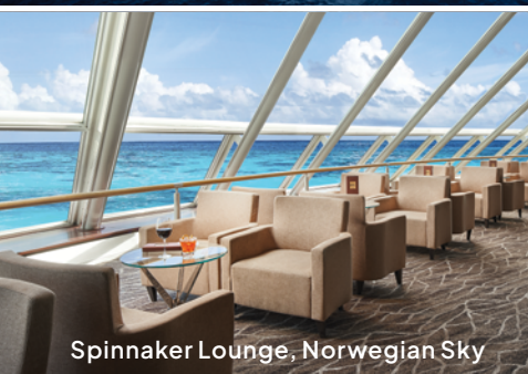
Spinnaker Lounge, Norwegian Sky