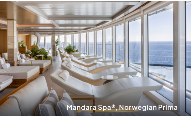
Mandara Spa®, Norwegian Prima