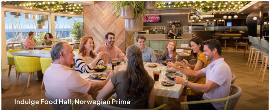
Indulge Food Hall, Norwegian Prima