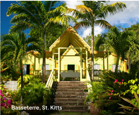
Basseterre, St. Kitts