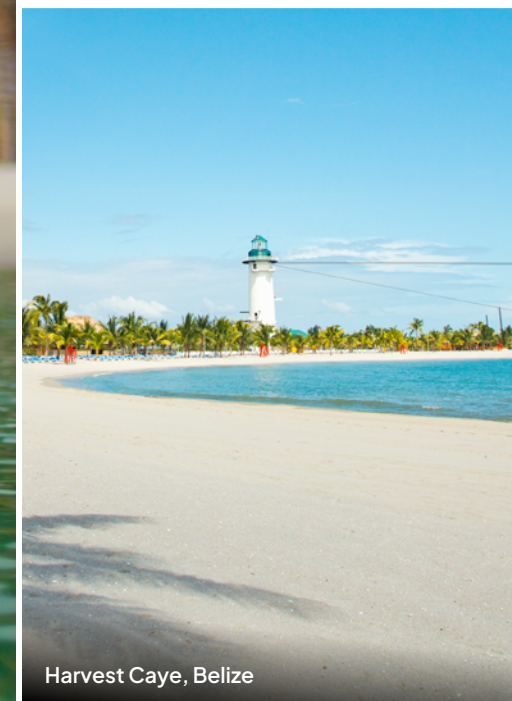
Harvest Caye, Belize