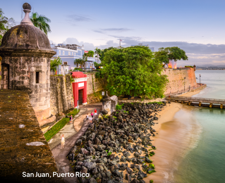
San Juan, Puerto Rico

In St. Thomas lässt sich der Tag bei einem Gläschen Sekt auf dem Katamaran genießen, während in der Dominikanischen Republik beeindruckende Wasserfälle warten. San Juan verzaubert mit farbenfrohen Kolonialstraßen und sonnigen Stränden, und auf Barbados zeigt sich die Karibik von ihrer schönsten Seite. Die Karibik hat einfach eine Menge zu bieten!