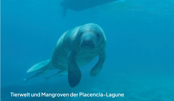
Tierwelt und Mangroven der Placencia-Lagune