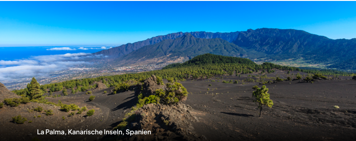
La Palma, Kanarische Inseln, Spanien