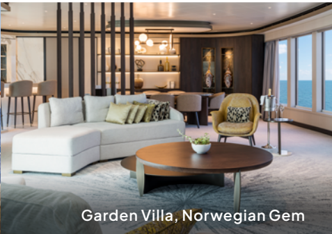
Garden Villa, Norwegian Gem

Norwegian Gem®, Norwegian Pearl®, Norwegian Jewel®