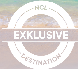
Great Stirrup Cay, Bahamas

Dein neuer Lieblingsstrand erwartet dich auf den Bahamas! Wähle zwischen einer 3-, 4- oder 5-tägigen Kreuzfahrt ab Miami, Orlando, Tampa oder Jacksonville – ideal als Verlängerung deines Florida-Urlaubs. Oder starte mit der ganzen Familie zu einer 8-tägigen Kreuzfahrt ab New York oder Philadelphia – inklusive Zwischenstopp ganz in der Nähe von Orlando's weltberühmten Freizeitparks. Ob du Lust auf tropisches Abenteuer, eine romantische Auszeit oder unvergessliche Momente mit den Kindern hast – bei uns findest du die perfekte Bahamaskreuzfahrt.