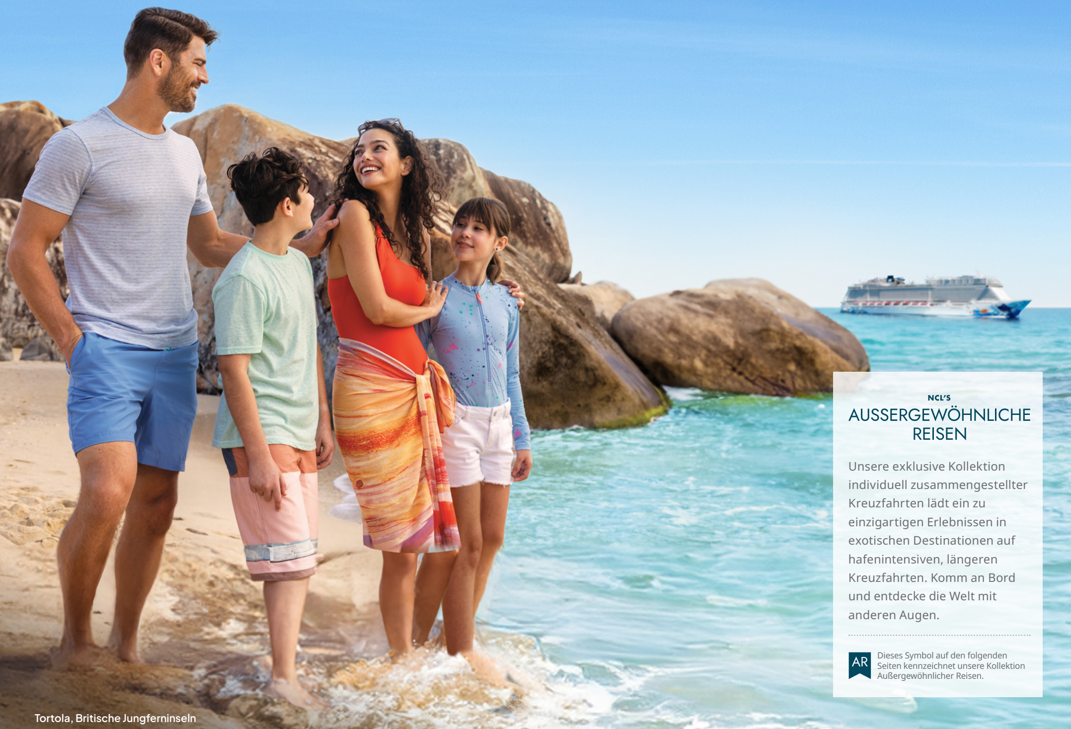
Tortola, Britische Jungferninseln