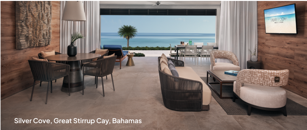
Silver Cove, Great Stirrup Cay, Bahamas