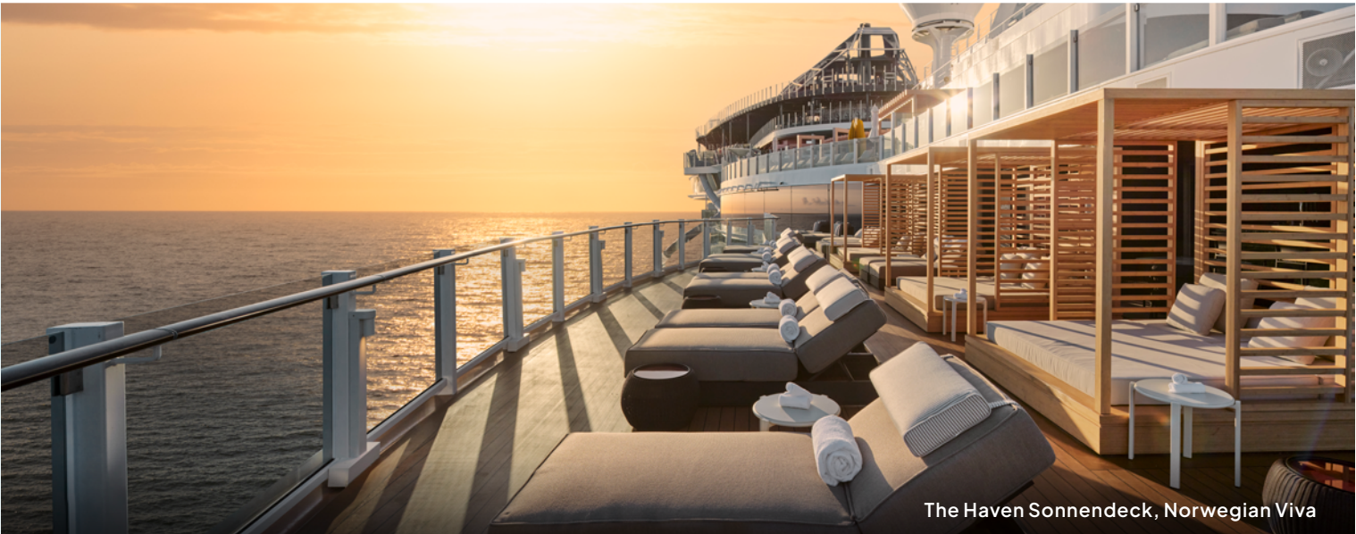
The Haven Sonnendeck, Norwegian Viva

Highlights: Aqua Slidecoaster, erweiterter Poolbereich und Promenadendeck Ocean Boulevard mit Infinitypools. The Haven by Norwegian®.