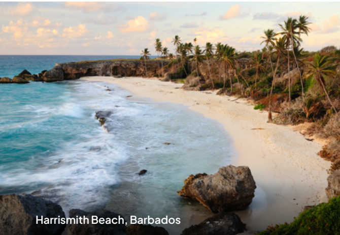
Harrismith Beach, Barbados