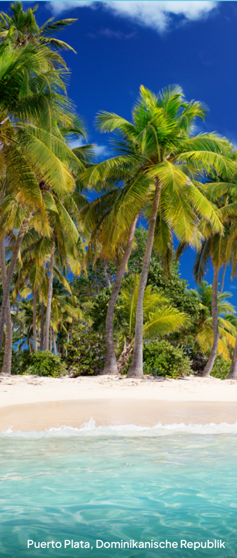
Puerto Plata, Dominikanische Republik

11 Tage Karibik: Dominikanische Republik und St. Thomas ab/bis New York