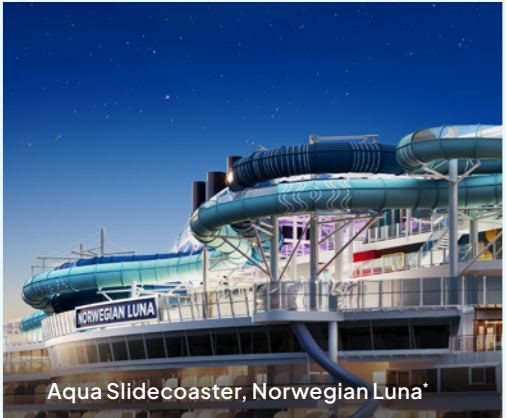
Aqua Slidecoaster, Norwegian Luna*