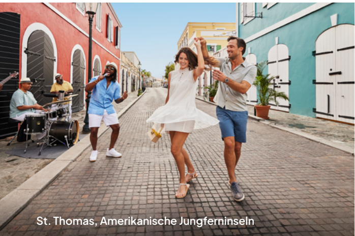
St. Thomas, Amerik. Jungferninseln