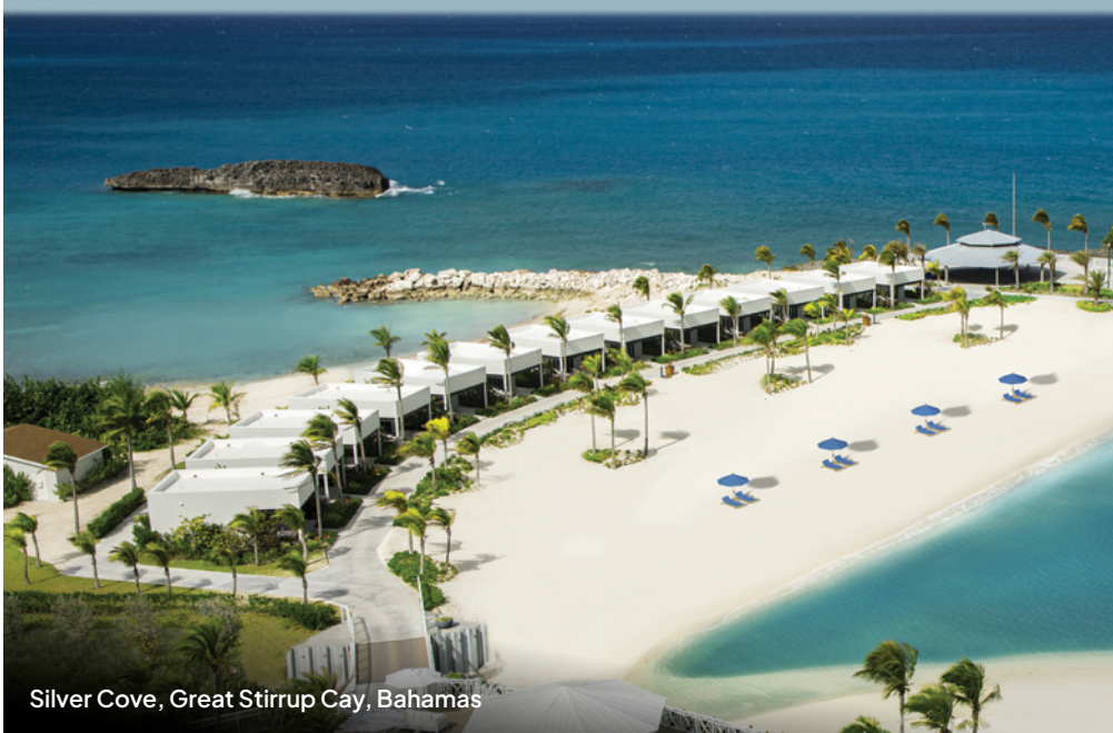
Silver Cove, Great Stirrup Cay, Bahamas

Silver Cove ist der perfekte Rückzugsort für alle, die Entspannung auf höchstem Niveau suchen. In diesem exklusiven Bereich genießt du einen Tag voller Ruhe und Genuss. Ob entspannt unter dem Sonnenschirm am weißen Sandstrand oder beim Eintauchen in die glasklare Lagune: Hier fällt Loslassen ganz leicht. Ein kühler Cocktail an der Moët & Chandon Bar, köstliche Speisen mit Meerblick am Buffet oder eine wohltuende Auszeit im Mandara Spa® - so lässt sich das gute Leben genießen.