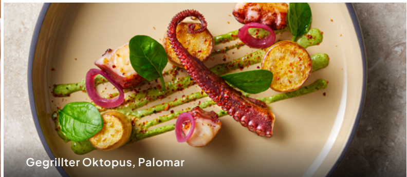
Gegrillter Oktopus, Palomar