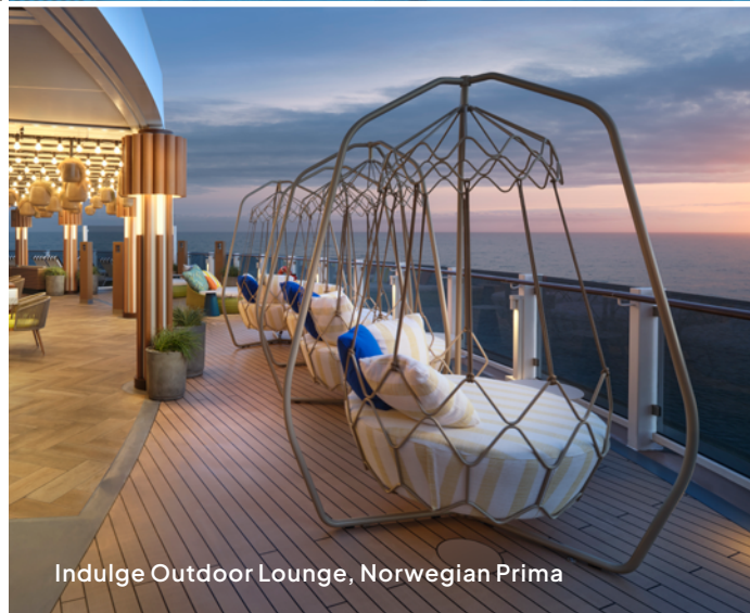
Indulge Outdoor Lounge, Norwegian Prima