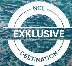
Great Stirrup Cay, Bahamas*

Das völlig neu gestaltete Great Stirrup Cay ist nicht einfach nur eine Insel. Das ist deine Einladung zu The Great Life – mit NCL®. Entdecke ein ganz eigenes Lebensgefühl, wenn du am 2.600 m 2 großen Pool mit einem kühlen Drink in der Hand entspannst – inklusive im Urlaubsupgrade More At Sea™ . Beim Sound der Jet Skis in der Ferne und der sanften Brise in deiner privaten Cabana. Beim Adrenalinkick, wenn du laut lachend die Rutschen im riesigen Wasserpark heruntersaust. Und wenn du pure Zufriedenheit spürst, während du den ganzen Nachmittag auf den weißen Sandstrand schaust. Hier bestimmst ganz einfach du den Rhythmus.