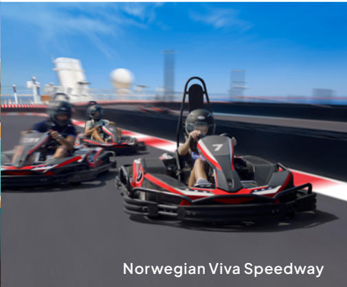
Norwegian Viva Speedway