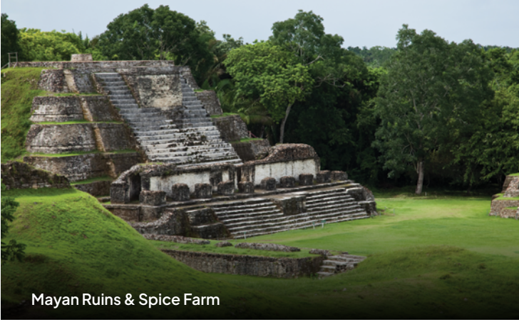
Mayan Ruins & Spice Farm