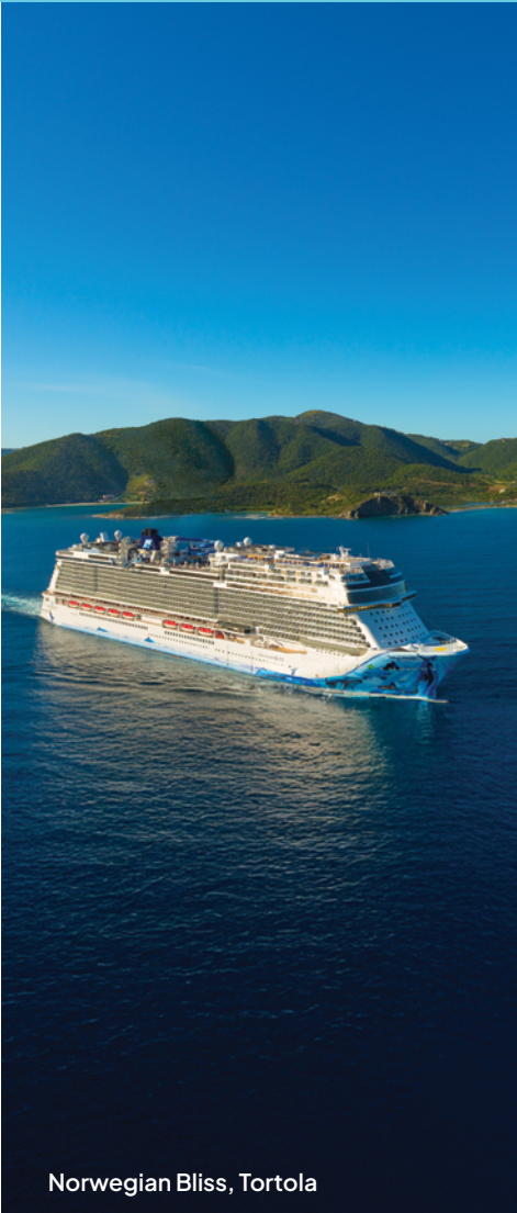
Norwegian Bliss, Tortola