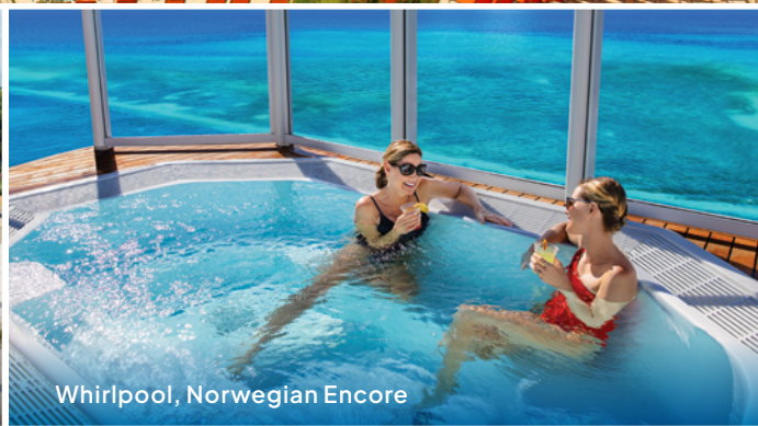
Whirlpool, Norwegian Encore

Die große NCL-Routenvielfalt durch die Karibik und die Bahamas schenkt dir mehr Zeit für Entdeckungen – in unseren Abfahrtschiffen entlang der US-Küste und direkt im Herzen der Karibik und natürlich auf den Trauminseln, die du während deiner Kreuzfahrt besuchst. Ob du an den paradiesischen Stränden der östlichen Karibik und der Bahamas entspannst, auf den Spuren vergangener Zeiten in der westlichen Karibik unterwegs bist oder unsere exklusiven Privatinseln entdeckst – mit NCL gestaltest du deinen Urlaub ganz so, wie du willst.