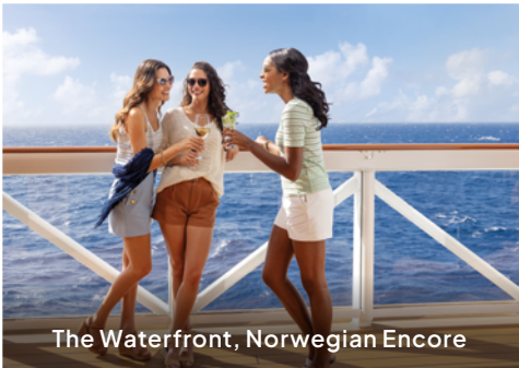
The Waterfront, Norwegian Encore