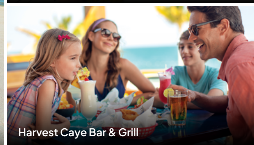
Harvest Caye Bar & Grill