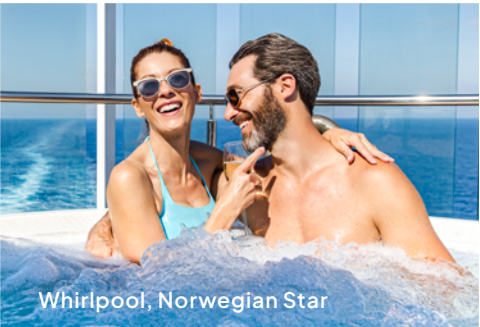
Whirlpool, Norwegian Star

Unser erstes Schiff mit Aqua Park, dem Spice H 2 O-Poolbereich nur für Erwachsene und einem erweiterten The Haven by Norwegian®, unserem Suiten-Komplex mit unseren luxuriösesten Unterkünften und privatem Zugang zu exklusiven Bereichen.