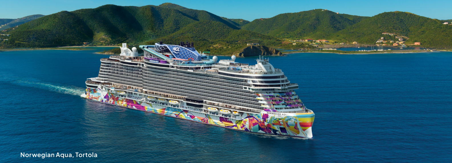
Norwegian Aqua, Tortola

Komm an Bord unserer preisgekrönten Schiffe und tauch ein in tropisches Urlaubsfeeling! Mit NCL entdeckst du die Karibik auf vielfältige Weise – mit einzigartigen Routen und exotischen Häfen. Starte in Miami auf Kreuzfahrten von 4 bis 14 Tagen und erkunde traumhafte Ziele wie Great Stirrup Cay, die Dominikanische Republik, Belize oder Aruba. Von Orlando, New Orleans oder Tampa aus erwarten dich siebentägige Touren nach Cozumel, Roatán und mehr. Ab Jacksonville oder Philadelphia führt die Reise nach St. Thomas, Tortola und in andere Inselparadiese. San Juan und Punta Cana dagegen sind ideale Ausgangspunkte, um die schönsten Ecken der südlichen Karibik zu entdecken. Und wer in New York an Bord geht, erlebt auf 10 bis 14 Tagen Highlights wie Antigua, St. Kitts oder St. Lucia. Ob östliche, westliche oder südliche Karibik – mit NCL zeigt sich die Karibik von ihren schönsten Seiten.