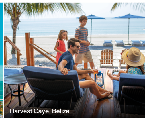
Harvest Caye, Belize