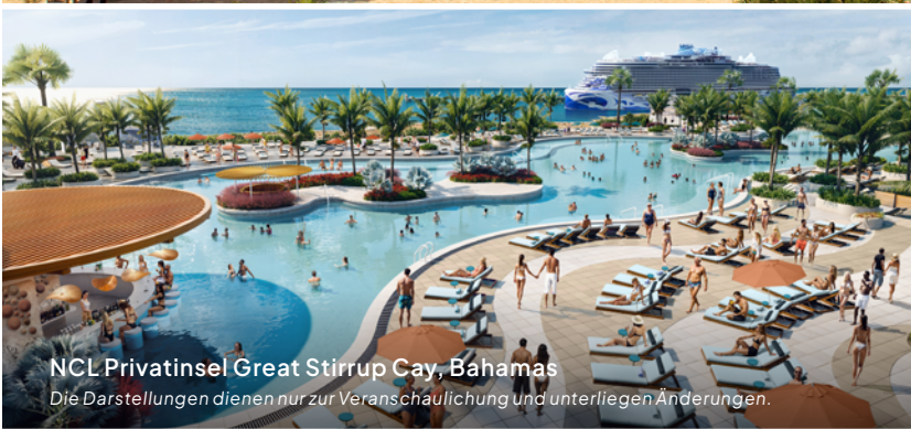
NCLPrivatinsel Great Stirrup Cay, Bahamas Die Darstellungen dienen nur zur Veranschaulichung und unterliegen Änderungen.