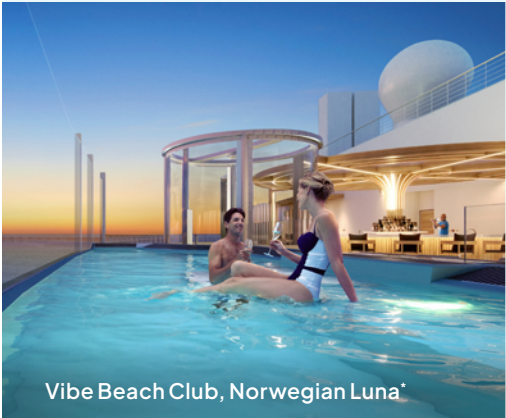
Vibe Beach Club, Norwegian Luna*