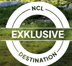
Great Stirrup Cay, Bahamas

Mit Norwegian Cruise Line® erlebst du in der Karibik und auf den Bahamas jeden Tag mehr – denn du packst nur einmal die Koffer aus und wachst jeden Morgen zu neuen Abenteuern auf. An einem Tag schwimmst du im türkisblauen Wasser von St. Lucia, gönnst dir danach eine Auszeit im Mandara Spa® und lässt den Tag bei einem Dinner in unseren exklusiven Spezialitätenrestaurants ausklingen. Am nächsten Tag genießt du The Great Life auf unserer komplett neu gestalteten Privatinself Great Stirrup Cay und drehst eine schnelle Runde nach der anderen auf den einzigen E-Kartbahnen auf See – immer begleitet von unserem aufmerksamen Service. Und mit unserem einzigartigen Urlaubsupgrade More At Sea™ holst du noch mehr aus deinem Traumurlaub heraus: Premium-Getränke, exklusive Spezialitätenrestaurants, Wi-Fi-Minuten und vieles mehr – für maximale Entspannung und pures Urlaubsfeeling. Wohin auch immer dich die Meeresbrise trägt – mit NCL® gibt es jeden Tag mehr zu entdecken.