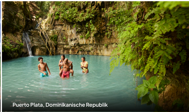
Puerto Plata, Dominikanische Republik