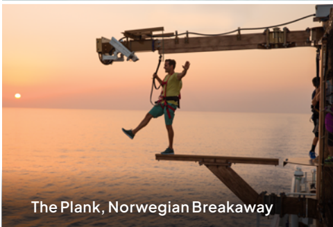
The Plank, Norwegian Breakaway

Norwegian Getaway®, Norwegian Breakaway®