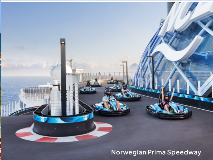
Norwegian Prima Speedway