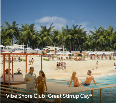
Vibe Shore Club, Great Stirrup Cay*