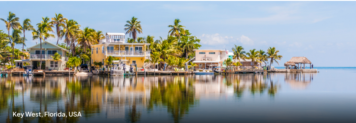
Key West, Florida, USA