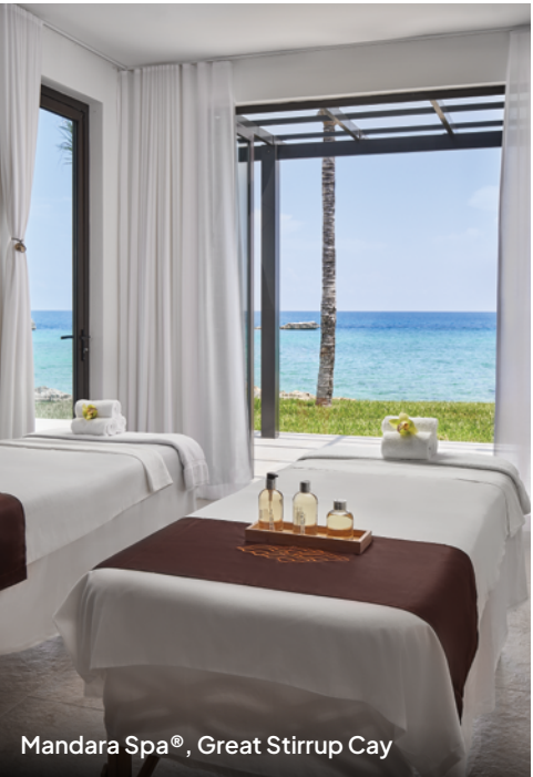
Mandara Spa®, Great Stirrup Cay