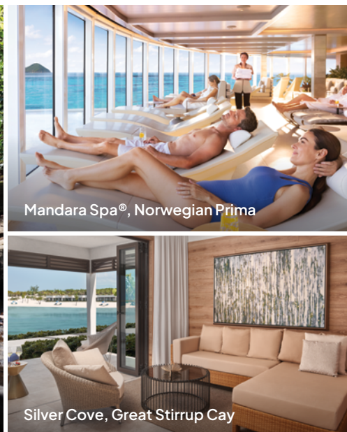
Mandara Spa®, Norwegian Prima