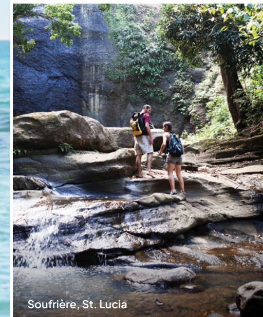
Soufrière, St. Lucia

Lass dich in türkisfarbenem Wasser treiben und an Bord von spektakulärem Entertainment begeistern. Entdecke beeindruckende Aussichtspunkte bei einer Wanderung und finde danach Ruhe und Erholung in der Thermal Suite des Mandara Spa®. Auf unseren privaten Inseln Great Stirrup Cay und Harvest Caye erwarten dich exklusive Strandtage unter tropischer Sonne – ganz privat, ganz für dich. Und für eine entspannte Anreise sorgen unsere Flugpakete, die von allen regionalen Flughäfen verfügbar sind. So startet dein Urlaub quasi direkt vor der Haustür.