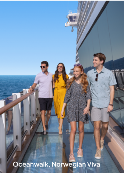
Oceanwalk, Norwegian Viva