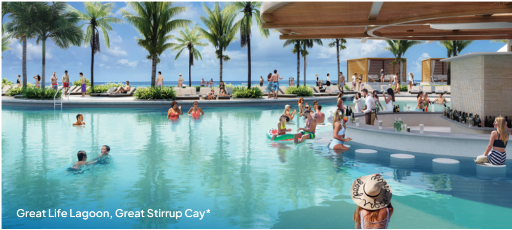
Great Life Lagoon, Great Stirrup Cay*