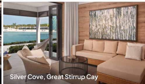
Silver Cove, Great Stirrup Cay