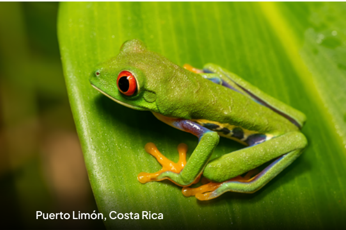
Puerto Limón, Costa Rica