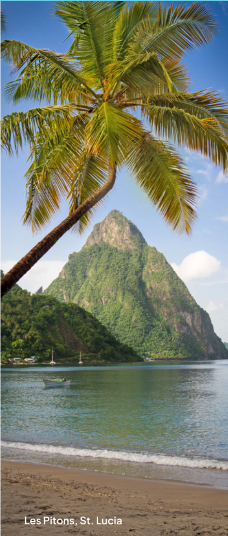
Les Pitons, St. Lucia

Norwegian Epic Dez 2025 Apr 2026 Norwegian Prima Nov-Dez 2026 Jan-März 2027