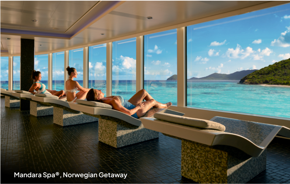
Mandara Spa®, Norwegian Getaway