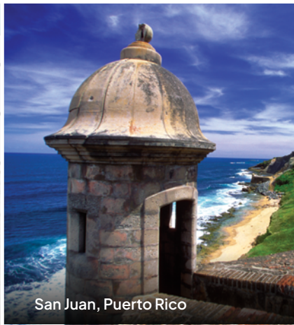
San Juan, Puerto Rico