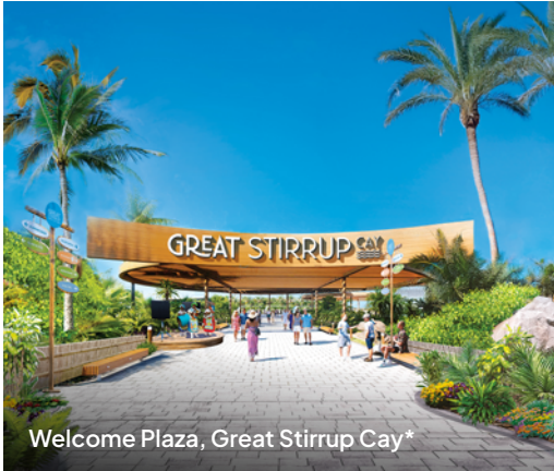
Welcome Plaza, Great Stirrup Cay*