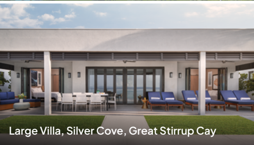
Large Villa, Silver Cove, Great Stirrup Cay