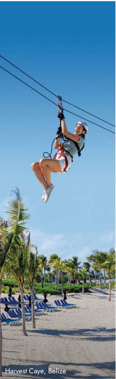
Harvest Caye, Belize

CHAT: HEIKE SCHWANEWEDE Coordinator Partnership Relations