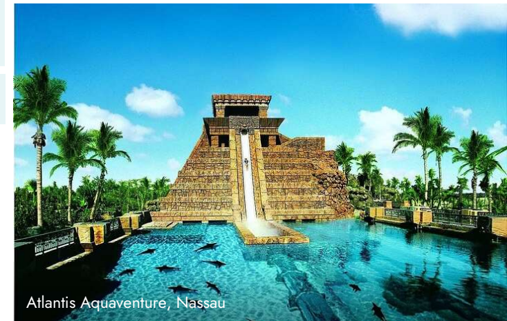
Atlantis Aquaventure, Nassau

Auf den Bahamas erwarten Sie Strand, Sonne und maximale Entspannung. Besuchen Sie vor Ihrer Kreuzfahrt das Kennedy Space Center von Port Canaveral